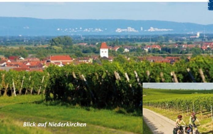
Blick auf Niederkirchen

Der Kraut- & Rüben-Radweg führt im Zeichen der Rübe von Bockenheim bis Schweigen-Rechtenbach durch die sonnenverwöhnte Pfalz. Radeln Sie von Hof zu Hof und erleben Sie von der Produktion über die Vermarktung bis hin zum Genuss köstlicher Gaumenfreuden die abwechslungsreiche Kulturlandschaft.