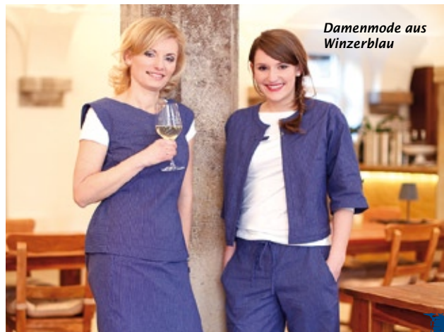
Damenmode aus Winzerblau

Sa. 10.00 – 15.00 Uhr oder n. telefon. Vereinbarung)