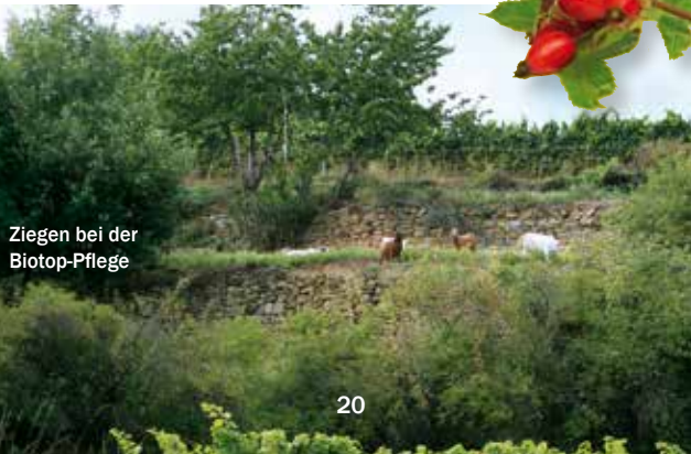
Ziegen bei der Biotop-Pflege

Geotop: Der Einbruch des Oberrheingrabens oberhalb von Deidesheim bietet einen Einblick in die Geschichte unserer Erde. Am Waldrand oberhalb des Kirchenbergs ist der intensiv verwitterte Sandstein zu sehen, der sich am Abbruch vom Oberrheingrabens zum Gebirgsrücken der Mittelhaardt zeigt. Der Buntsandstein grenzt mit einer scharfen Linie an eiszeitlichen Löss. Dieses Phänomen ist nur an sehr wenigen Stellen so deutlich erkennbar.