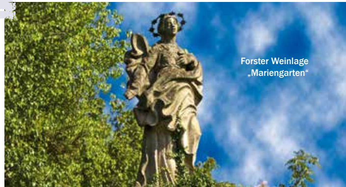
Forster Weinlage „Mariengarten“

Buchung: Weingut Herbert Gießen Erben, Weinstr. 3, 67146 Deidesheim Tel. 06326-391, weingut-giessen@t-online.de