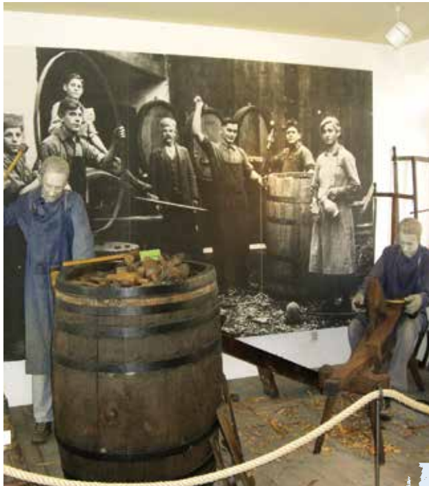
Küfer bei der Arbeit an Fässern

Im Obergeschoss steht auch das Thema Wein und Religion im Mittelpunkt. Außerdem ist hier der historische Ratssaal, 1912 aus Spenden der Weingüter v. Bassermann-Jordan, Reichsrat v. Buhl und Biffar eingerichtet.