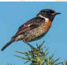
Das seltene Schwarzkehlchen

Mit dem Schutz der Marlachwiesen in der Urlaubsregion Deidesheim, einem ca. 103 ha großen Gebiet, wird ein schützenswertes Feuchtgrünland erhalten, das typischen und seltenen Arten, wie z.B. der Sumpfdotterblume oder dem Schwarzkehlchen Schutz bietet. Seit 2012 versorgen die Stadtwerke Deidesheim Betriebe der Weinwirtschaft und touristische Betriebe mit 100 % Naturstrom und ganz aktuell die öffentlichen Ladesäulen für E-Autos in Deidesheim. Auch die großen Veranstaltungen in Deidesheim, wie z.B. die Deidesheimer Weinkerwe, werden damit versorgt.