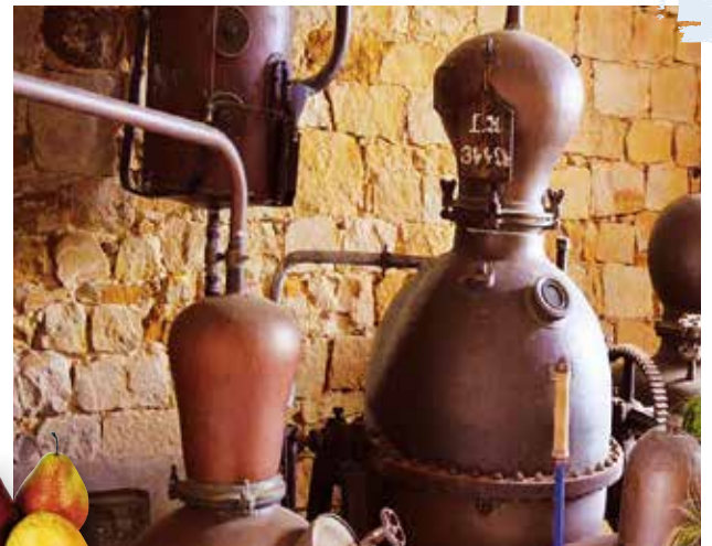
Alte Destillations- apparate