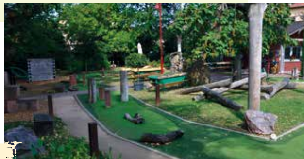
Minigolfparcours im Erlebnispark

Sie sind für Kinder, ältere Menschen oder auch Rollstuhlfahrer zugänglich. Kernelemente sind die 9-Loch-Erlebnisgolf-Anlage, der Boule-Platz, ein Kneipp-Armbecken, ein Sinnesparcours, ein Wasserspielbereich und verschiedene Kletter- und Klangbereiche. Besonders ins Auge fällt der Sandsteinfindling, in den von Bettina C. Morio ein Relief der Deutschen Weinstraße eingearbeitet wurde. Eintritt frei, Parkplätze vorhanden, Hunde sind leider nicht erlaubt.