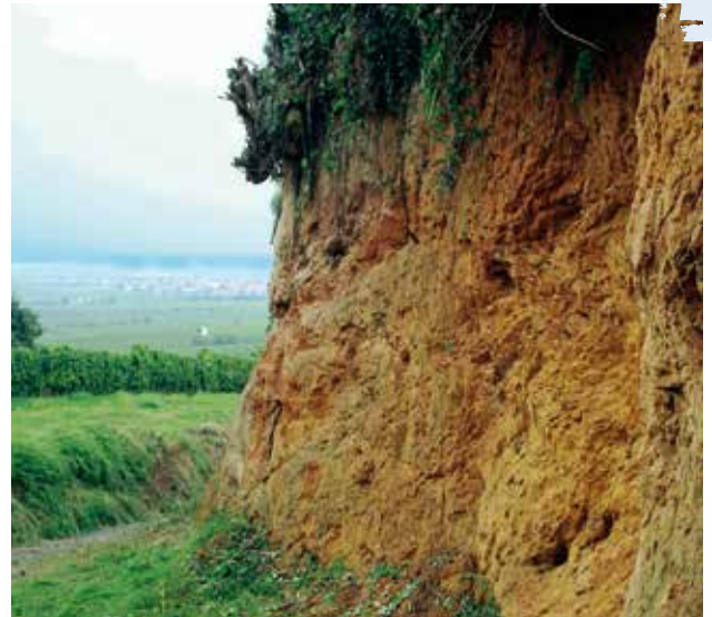
Übergang vom Löss zum Sandstein

Geotop: Der Einbruch des Oberrheingrabens oberhalb von Deidesheim bietet einen Einblick in die Geschichte unserer Erde. Am Waldrand oberhalb des Kirchenbergs ist der intensiv verwitterte Sandstein zu sehen, der sich am Abbruch vom Oberrheingrabens zum Gebirgsrücken der Mittelhaardt zeigt. Der Buntsandstein grenzt mit einer scharfen Linie an eiszeitlichen Löss. Dieses Phänomen ist nur an sehr wenigen Stellen so deutlich erkennbar.