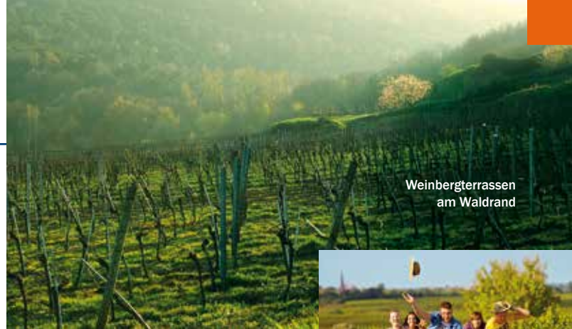
Weinbergterrassen am Waldrand