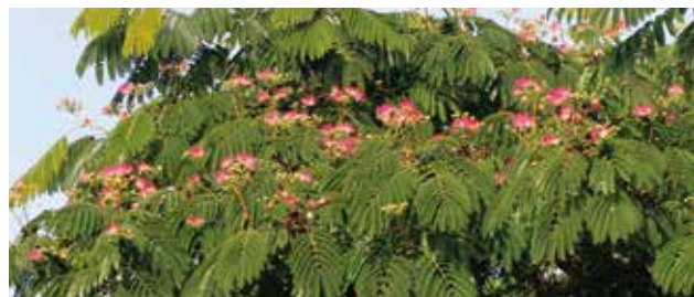
Blühender Seidenbaum im Stadtgarten