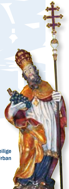
Der Weinheilige St. Urban

Historisches Rathaus Marktplatz 9, Deidesheim, Tel. 06326/981561; Öffnungszeiten: auf Anfrage